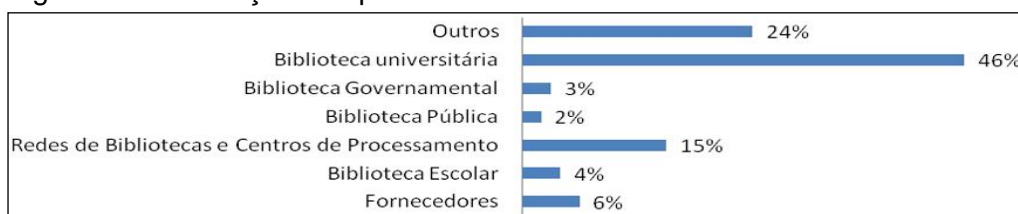
Figura 1 - Distribuição dos perfis de bibliotecas brasileiras no WorldCat.

A partir do portal e busca por instituição brasileiras, foram encontradas 299 (duzentos e noventa e nove) instituições com perfil no WorldCat. Considerando a categorização proposta pelo portal e lembrando que três instituições não adicionaram a tipologia em seu cadastro, constatou-se a distribuição conforme a figura 1.