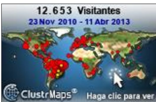
Figura 3 – ClustrMaps