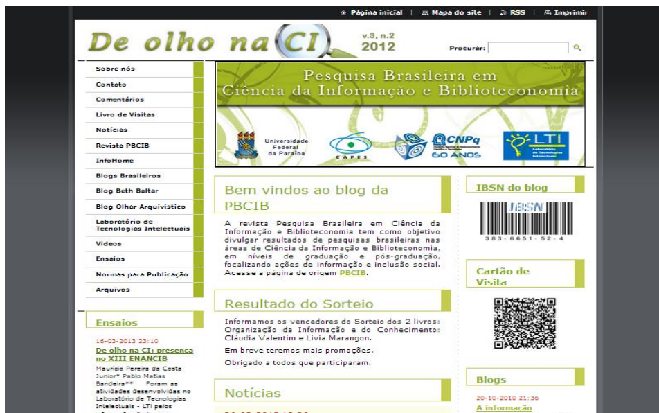
Figura 2 – Página inicial do blog De olho na CI , da revista PBCIB.

Fonte: http://www.deolhonaci.com/ . Acesso em agosto de 2010.