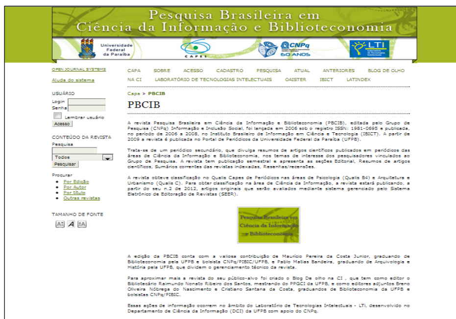
Figura 1 – Página da PBCIB.