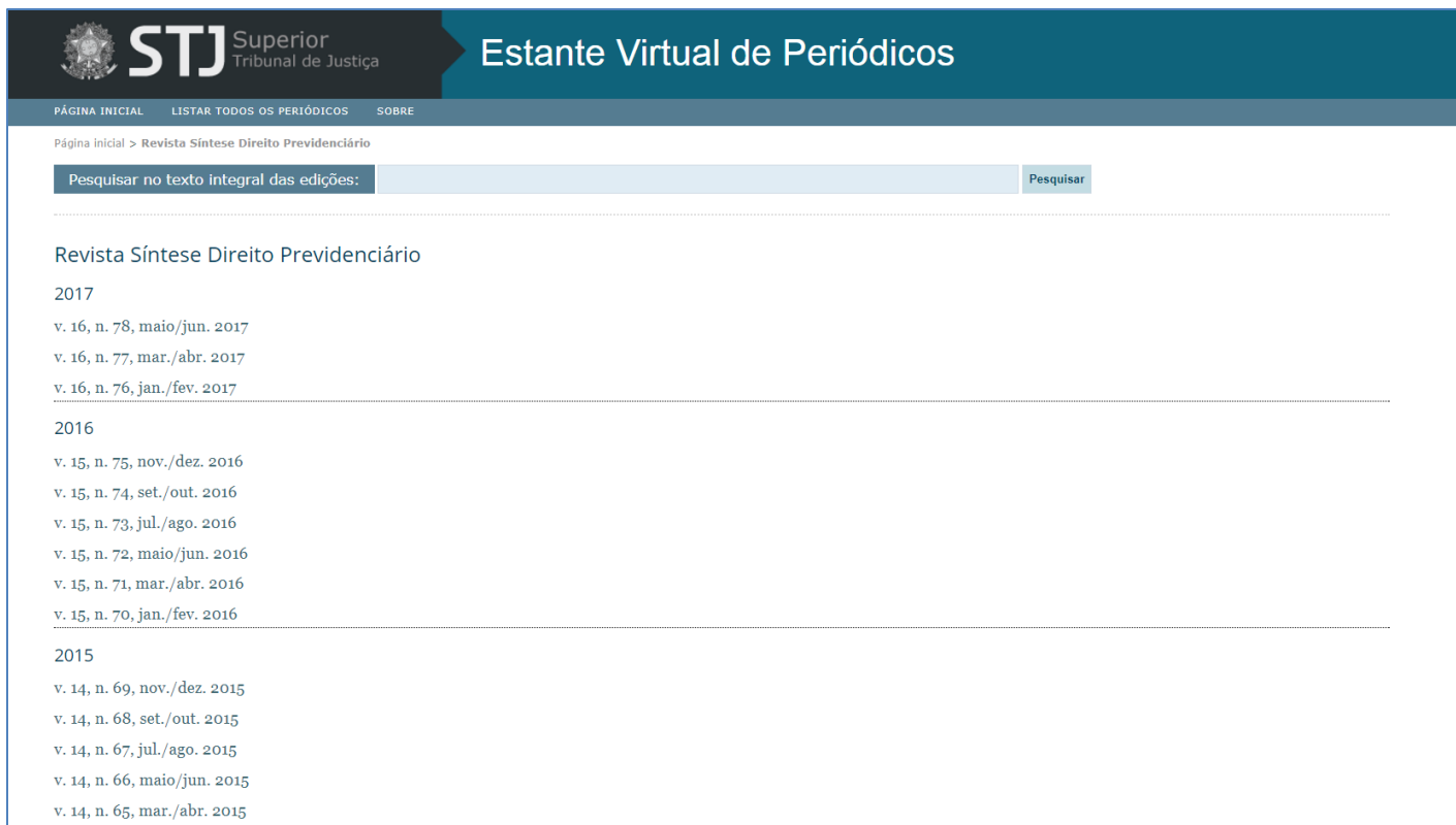
Figura 2 - Tela de um título do periódico contendo os volumes em ordem cronológica decrescente de publicação