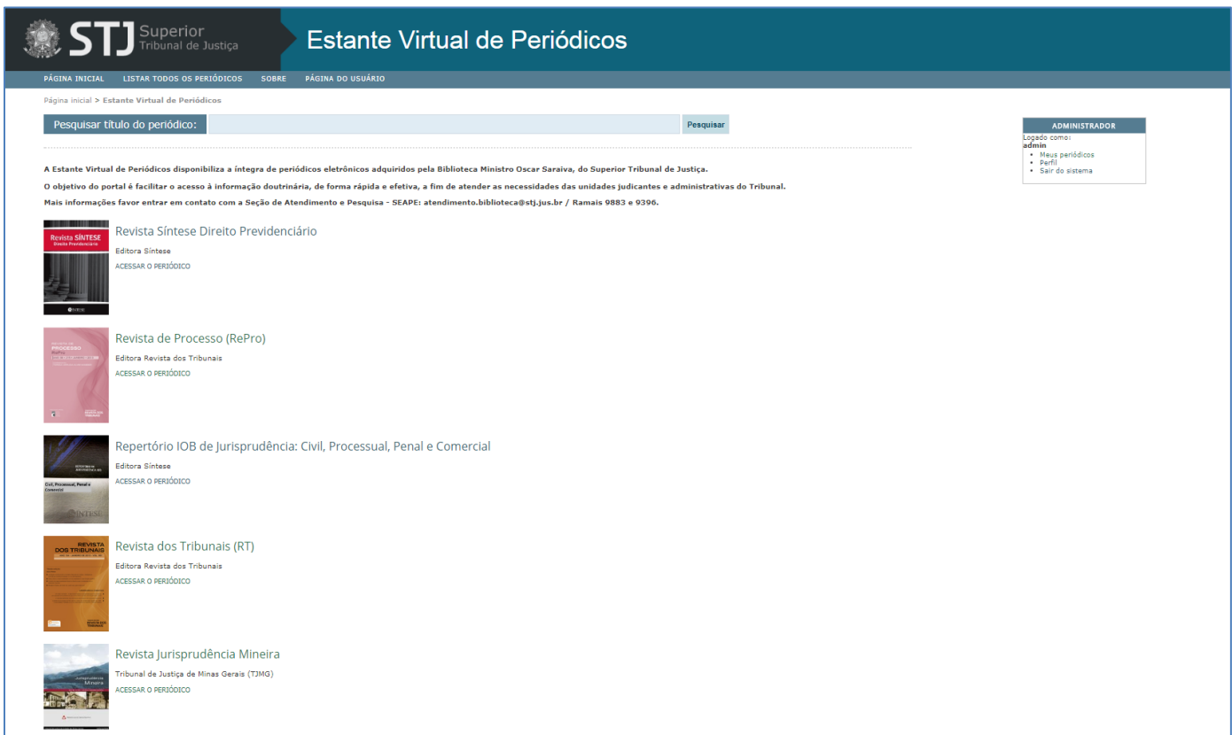
Figura 1 - Tela inicial da Estante Virtual de Periódicos onde consta a lista de títulos

Abaixo três imagens sequenciais da Estante Virtual de Periódicos: