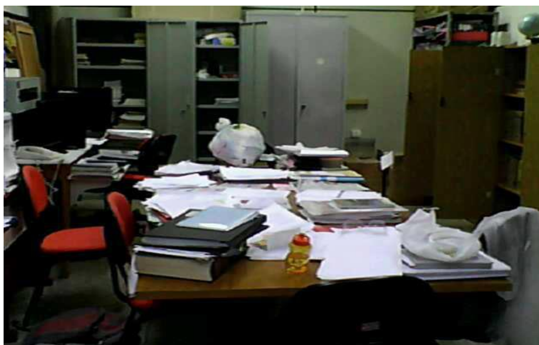
Figura 2– Foto da organização e catalogação dos livros e cartilhas.

O CD-NUPED da Universidade Federal de Mato Grosso, campus de Rondonópolis foi idealizado a partir das necessidades da pesquisa interinstitucional “Cartilhas escolares: ideários, práticas pedagógicas e editoriais: construção de repertórios analíticos e de conhecimento sobre a história da alfabetização, do livro, da leitura e das práticas editoriais – MG/RS/MT.”