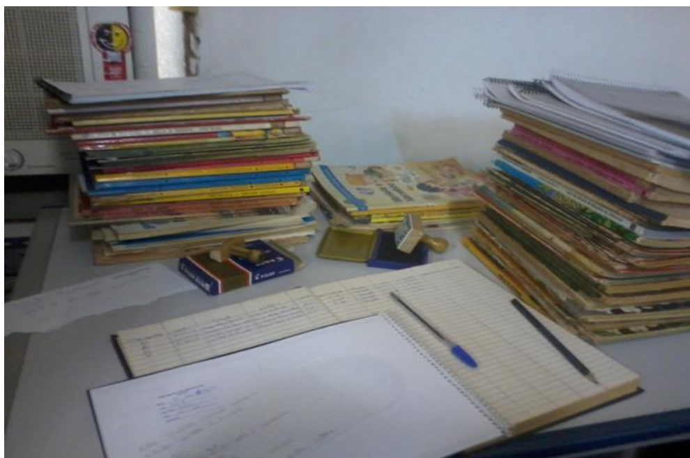
Figura 3 – Etapa da carimbagem, registro, catalogação, classificação e indexação Fonte: Centro de Documentação/NUPED/Rondonópolis (2012-2013).