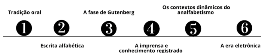
Imagem 1 - Etapas de armazenamento e transmissão de informação na sociedade

O processo comunicacional sempre foi dinâmico e adequado ao seu contexto. Kevin McGarry em seu livro O contexto dinâmico da Informação (1999), elenca seis etapas de armazenamento e transmissão de informação na sociedade, conforme a imagem a seguir: