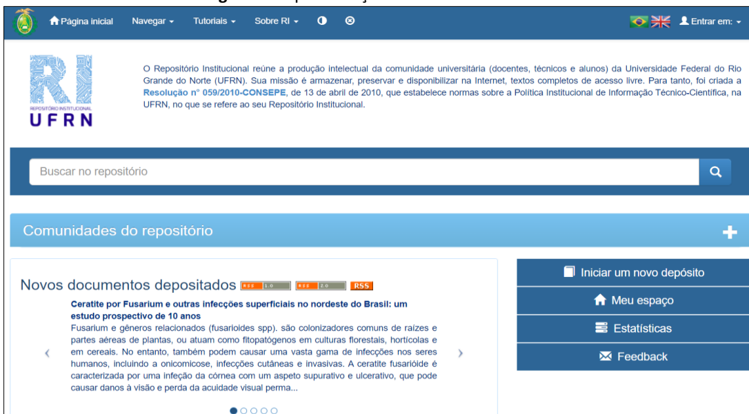
Figura 2 – Apresentação da tela inicial do RI-UFRN