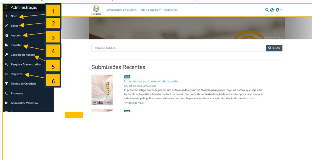
Figura 3. Administração do sistema em DSpace