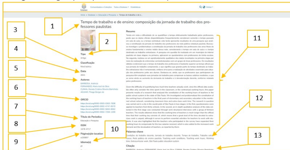
Figura 2. Página principal da Edubase no DSpace