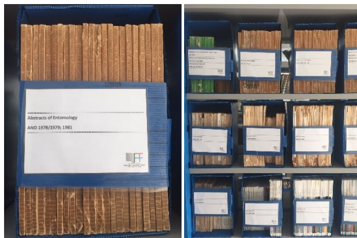
Figura 2 – Caixas de poliondas onde são acondicionados os periódicos

Ainda sobre a organização do acervo, foi proposto acondicionar os periódicos em caixas de poliondas, realizando adaptações nas caixas para que pudessem arquivar os periódicos e serem bem acomodadas nas estantes.