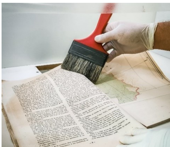
Figura 1 – Higienização de periódicos

Referente a condição física, alguns encontram-se com danos e necessitam de pequenos reparos, retirada de grampos, além de estarem empoeirados precisando de higienização. As estantes são feitas em aço e encontram-se em bom estado, além de ter espaço para acomodar toda a coleção.