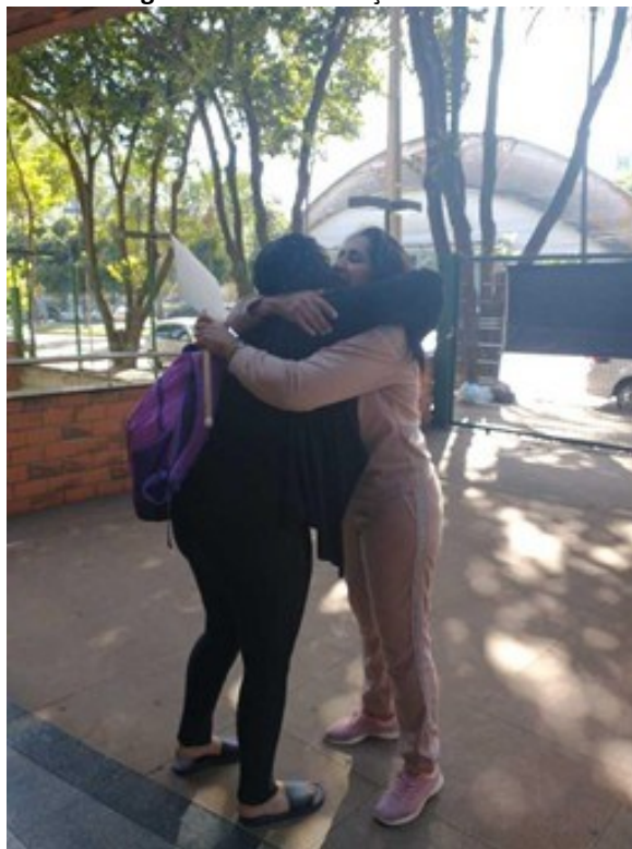
Figura 5 - Dia do abraço na BSCAN