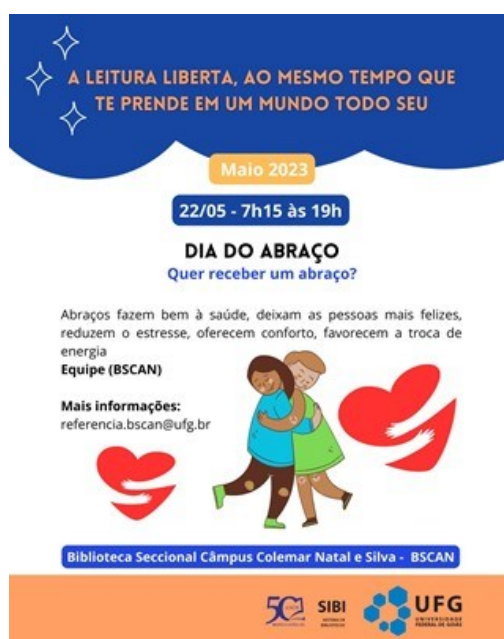
Figura 1 - Dia do abraço na BSCAN

A experiência do Dia do Abraço na Biblioteca Universitária proporcionou uma série de resultados positivos. Os usuários relataram uma sensação de acolhimento e pertencimento, o que contribuiu para a melhoria do clima emocional na biblioteca. Seguem alguns registros da ação: