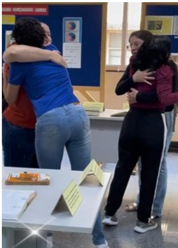
Figura 3 - Dia do abraço na BSCAN