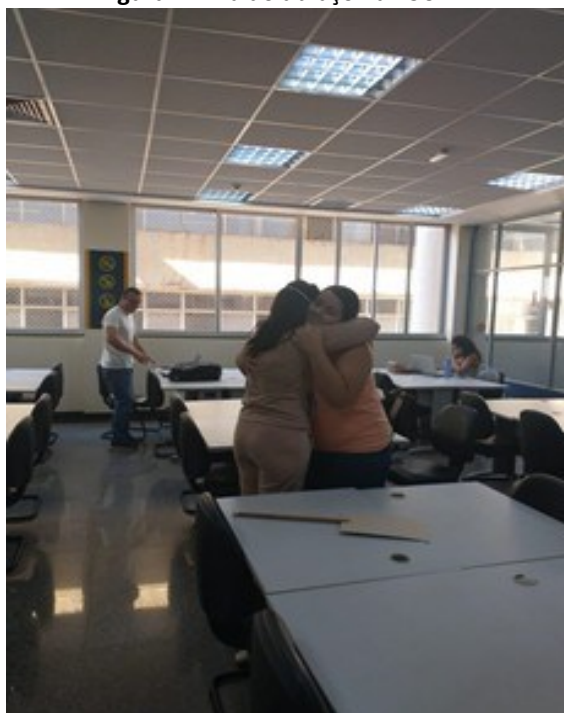
Figura 4 - Dia do abraço na BSCAN

Descrição: Fotografia de duas bibliotecárias abraçando usuárias da biblioteca